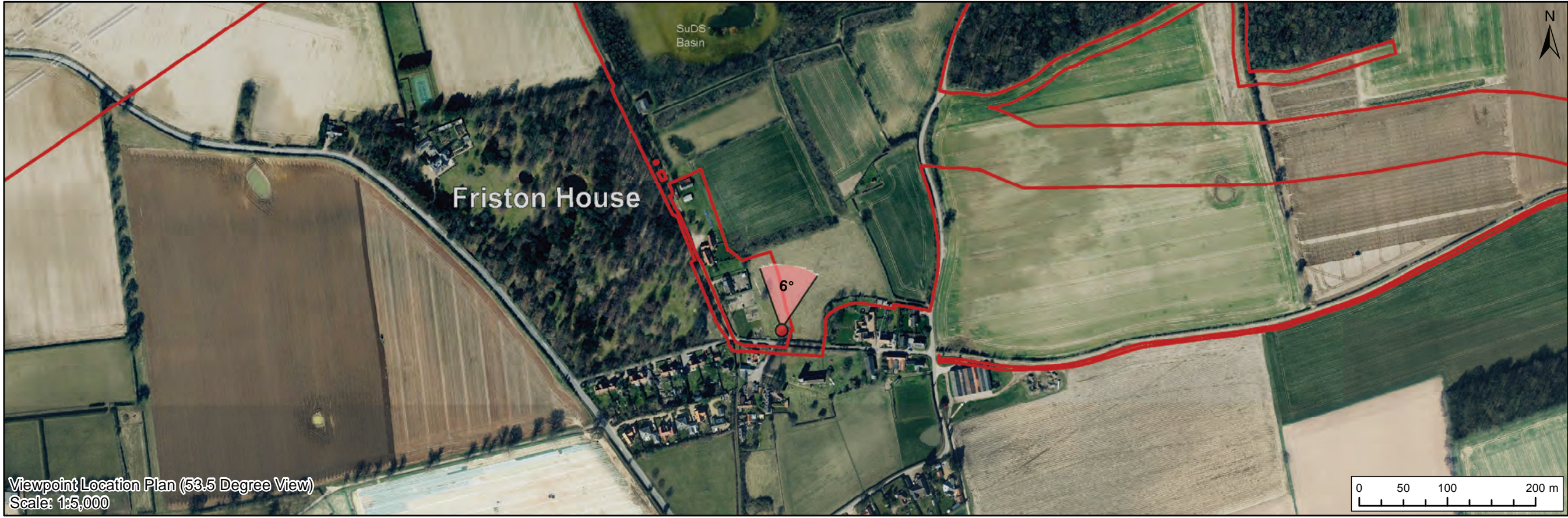
Viewpoint Location Plan (53.5 Degree View) Scale: 1:5,000