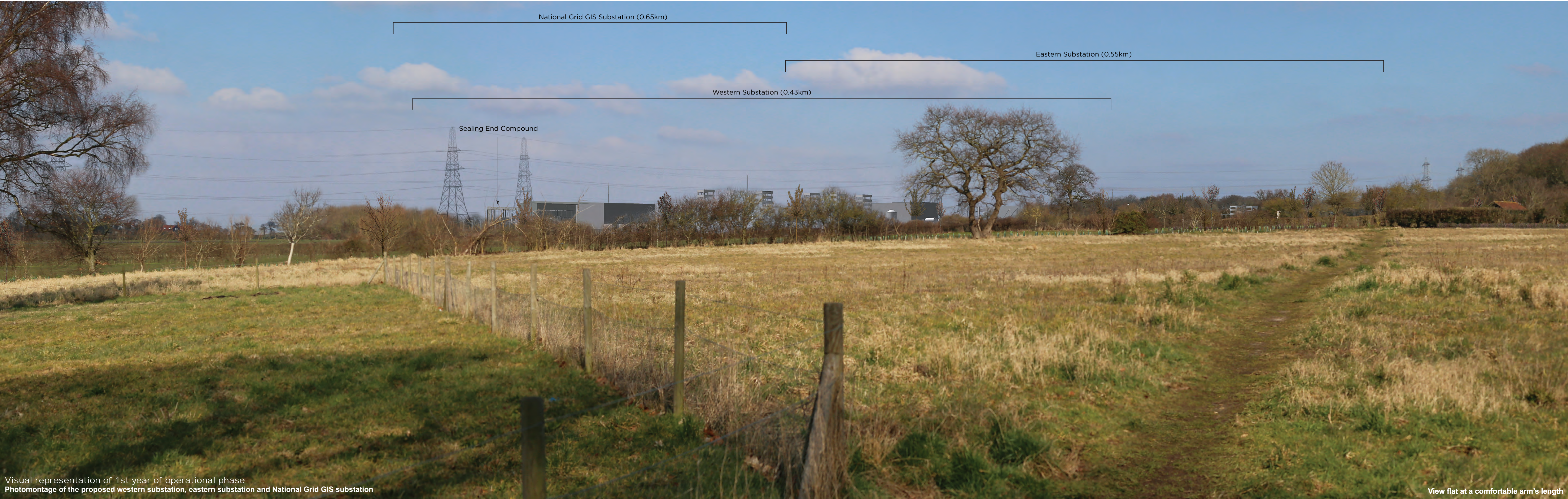
Visual representation of 1st year of operational phase Photomontage of the proposed western substation, eastern substation and National Grid GIS substation