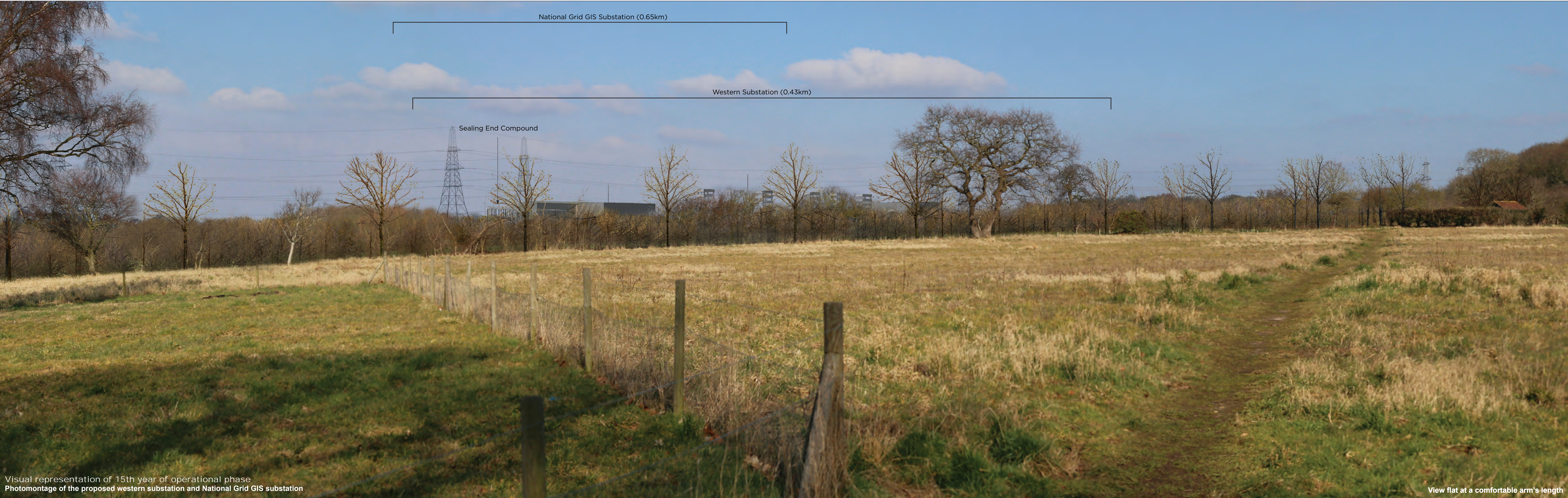
Visual representation of 15th year of operational phase Photomontage of the proposed western substation and National Grid GIS substation