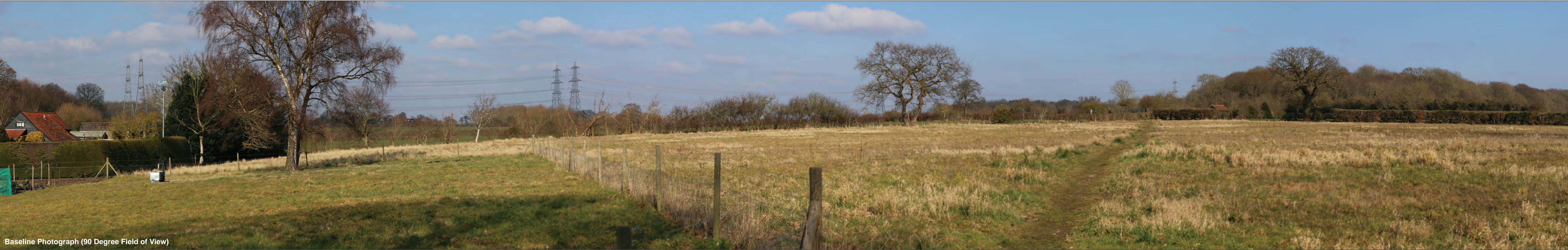
Baseline Photograph (90 Degree Field of View)