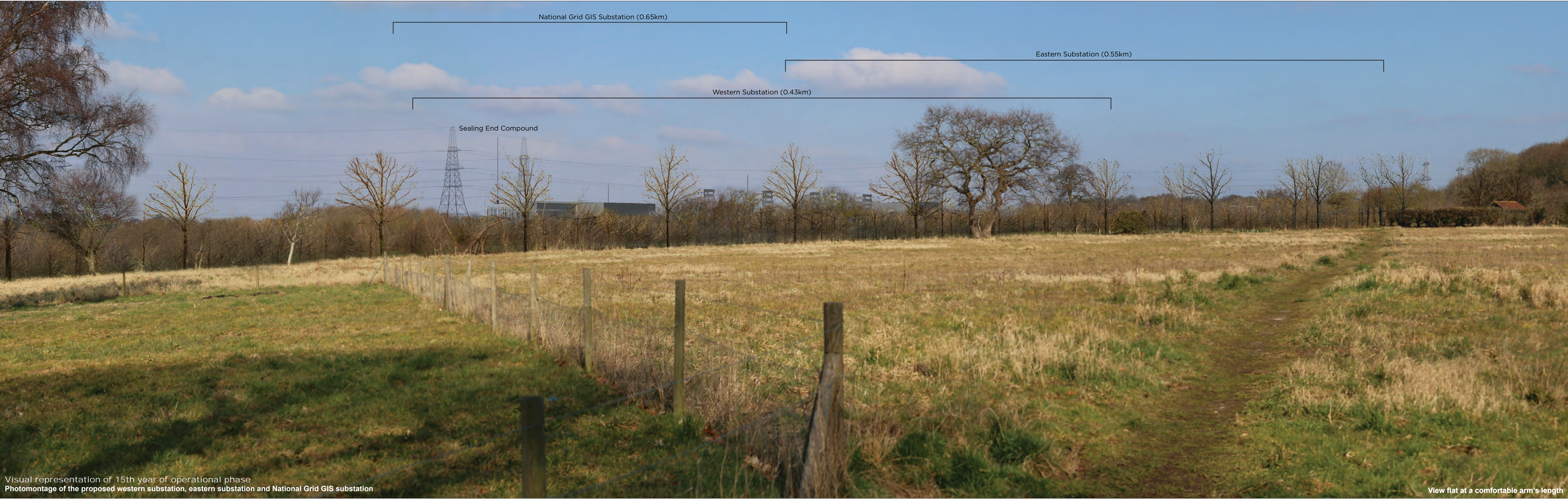
Visual representation of 15th year of operational phase Photomontage of the proposed western substation, eastern substation and National Grid GIS substation