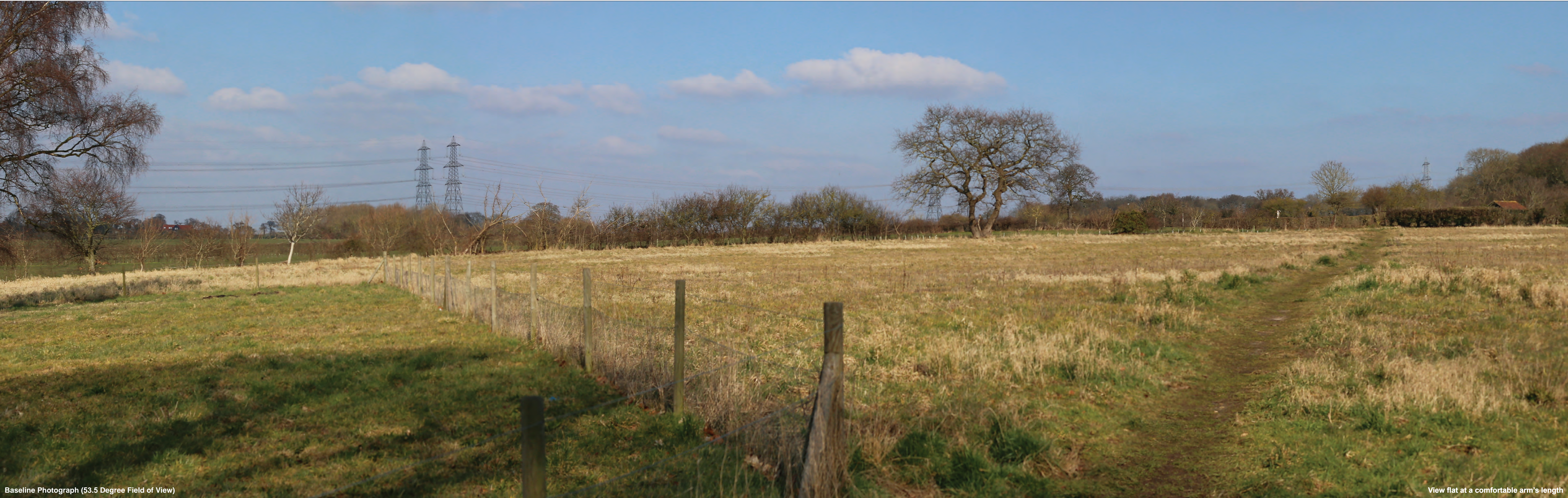
Baseline Photograph (53.5 Degree Field of View)